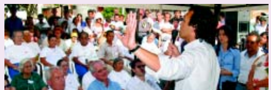
La comunidad recibe la explicación sobre los proyectos