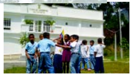
La Casa quiere convertirse en un lugar de encuentro

La obra se realizó en un lote de 400 metros cuadrados, con un área construida de 612 metros cuadrados. Estuvo dividida en dos etapas: estructura y redes de servicios; acabados de la Casa y construcción del colector de aguas residuales; amoblamiento y dotación de equipos tecnológicos.