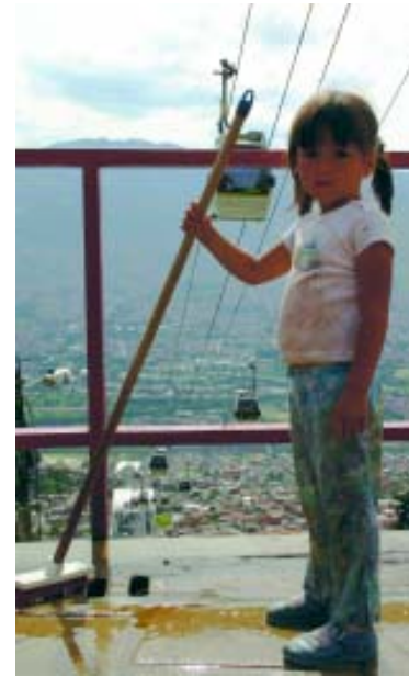
Niños y niñas de familias en el nivel 1 y 2 del Sisbén, menores de 6 años, son el objetivo principal del programa Buen Comienzo

En Medellín se calcula que más del 60 por ciento de los niños y niñas viven por debajo de la línea de pobreza, pues están ubicados en el