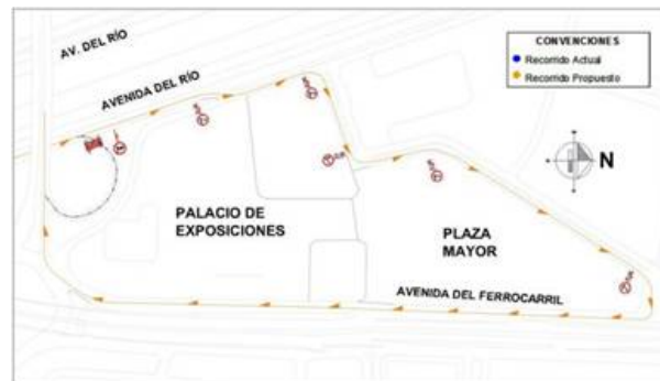
Esquema desvío Nor-oriental.