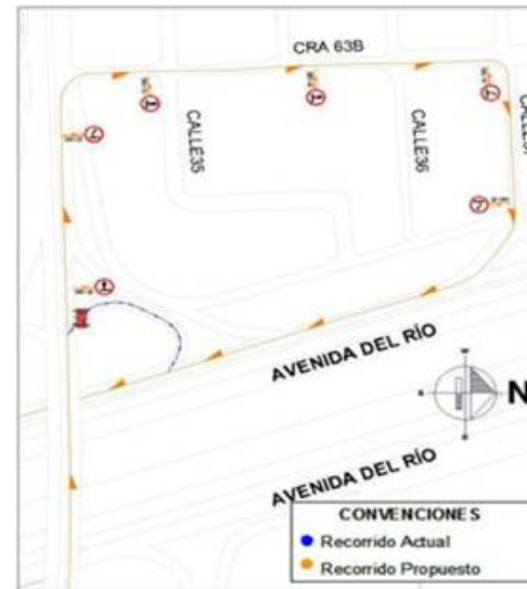
Esquema desvío Nor-occidental.

La Secretaría de Obras Públicas pide comprensión a la ciudadanía que se verá afectada por estos trabajos y recomienda circular con precaución, tomar vías alternas y seguir las indicaciones del personal de obra.