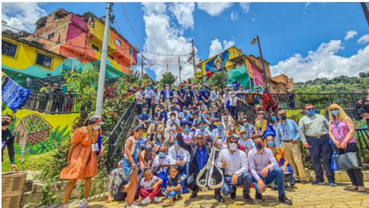
Informe de Rendición pública de cuentas DAP