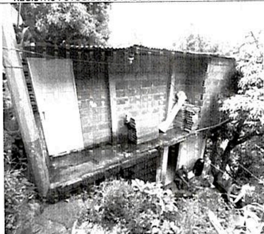
Registro fotografico Construcción en bloques de arcilla y zinc

REGISTRO FOTOGRAFICO PREDIO CON CBML 07220420001