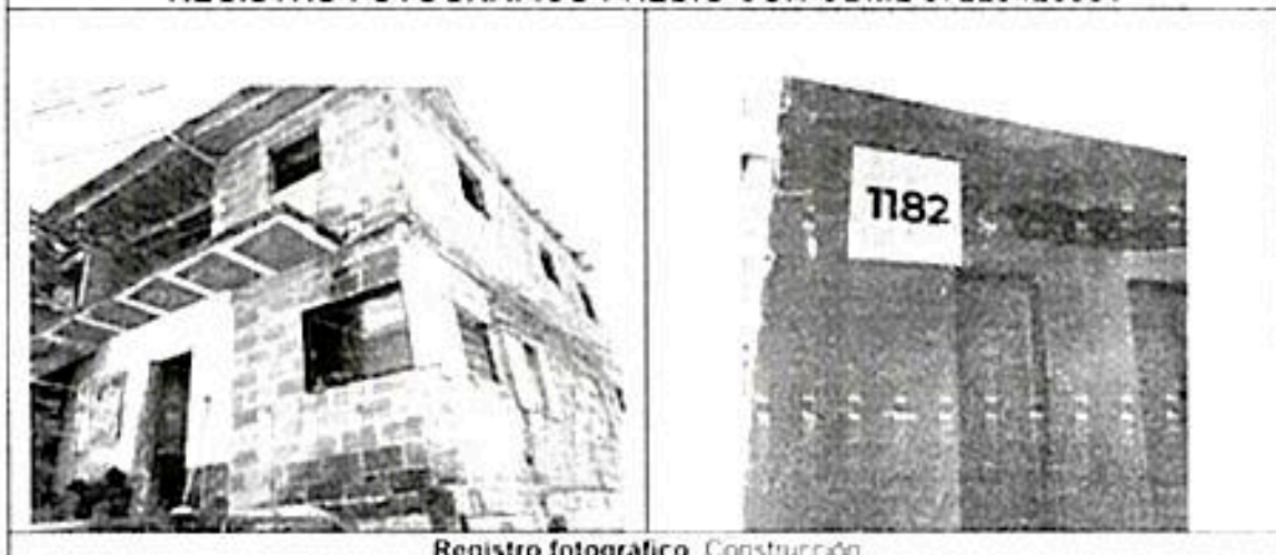
Registro fotográfico Construcción