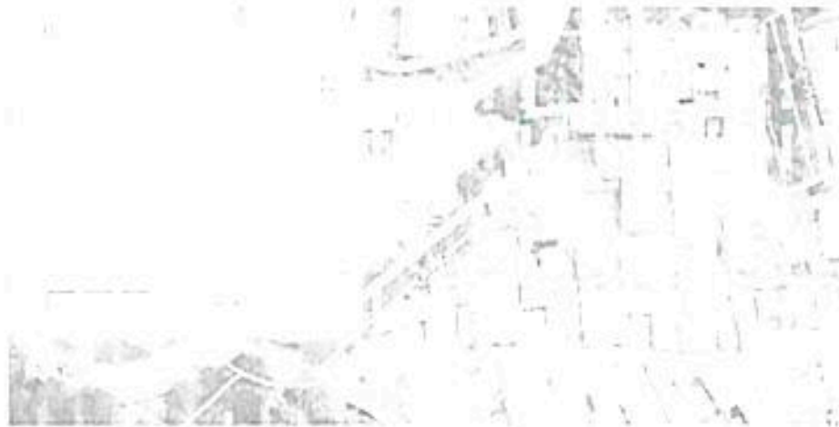
Gráfico 1. Local, alocado por el [ ] Tomas de Tapas y WCB