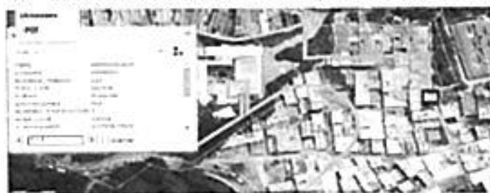
Gráfico 1. Localización del predio

□ Centro Administrativo Distrital CAD Calle 44 N° 52-165. Código Postal 50015 Línea de Atención a la Ciudadanía: (604) 44 44 144 Conmutador: (604) 385 55 55 Medellín - Colombia