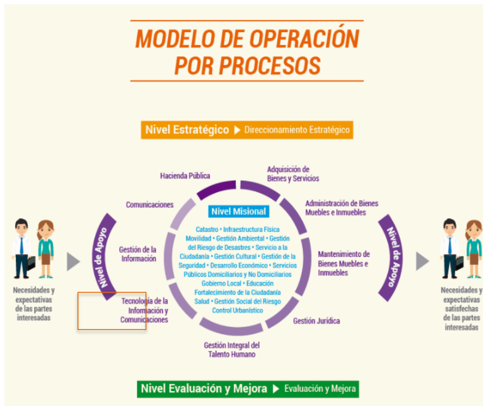
Ilustración 3: Modelo de Operación por Procesos Alcaldía de Medellín https://www.medellin.gov.co/lsolucion

El objetivo del Proceso Tecnología de la Información y de las Comunicaciones es dirigir, gestionar y controlar las soluciones y los servicios tecnológicos y archivísticos, mediante la implementación de sistemas de información, herramientas e instrumentos organizacionales y administrativos, para asegurar la disponibilidad de la plataforma, de los servicios y el cubrimiento a los procesos que operan en toda la Administración.