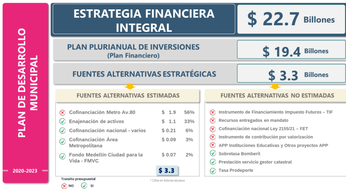
Ilustración 1: Fuentes Alternativas Estratégicas - Presupuesto Plan de Desarrollo “Medellín Futuro”

De esta forma para el periodo 2020-2023 el Plan de Desarrollo “Medellín Futuro” proyectó un total de $22,7 billones de recursos para la financiación de sus programas de inversión, diferenciando su fuente de origen: $19,4 billones: Recursos provenientes de fuentes tradicionales proyectadas en el Plan Financiero por la Administración Central y $3,3 billones: Recursos provenientes de Fuentes Alternativas Estratégicas estimadas, como se ilustra en el siguiente gráfico.