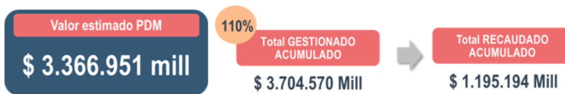
Ilustración 2. Resumen de la Gestión Acumulada de las Fuentes Alternativas Estratégicas 2020-2023

Durante el cuatrienio 2020-2023 los logros alcanzados y el proceso de materialización de las Fuentes Alternativas Estratégicas establecidas en el Plan de Desarrollo, permitieron que los recursos ascendieran a $3,36 billones, la administración distrital ha gestionado recursos por $3.7 billones (110%) y ha recibido recaudos efectivos por $1,19 billones.