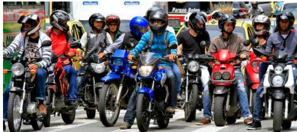
Conductores de motos