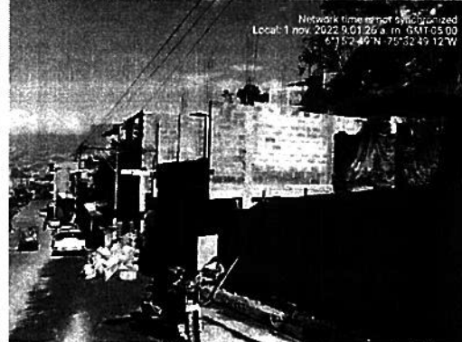
Foto 1 y 2. Imagen inmueble visitado