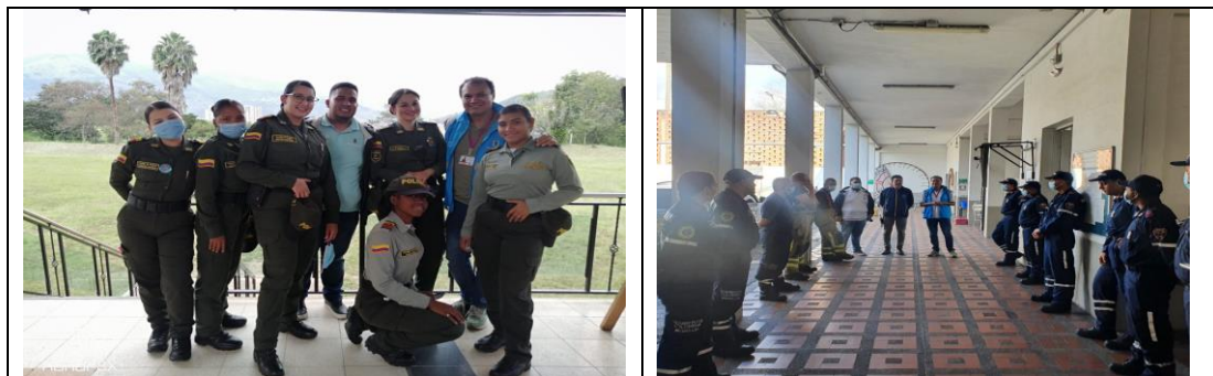
Tabla 5. Registro fotográfico

Abordando el público estratégico de comerciantes realizaron 15 entre reuniones, sensibilizaciones, recorridos y voz a voz: