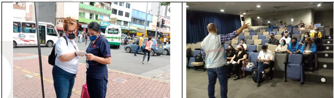
Tabla 3. Registro fotográfico

Abordando el público estratégico de residentes e inquilinatos la sumatoria es de 16 reuniones, sensibilizaciones, recorridos y voz a voz: