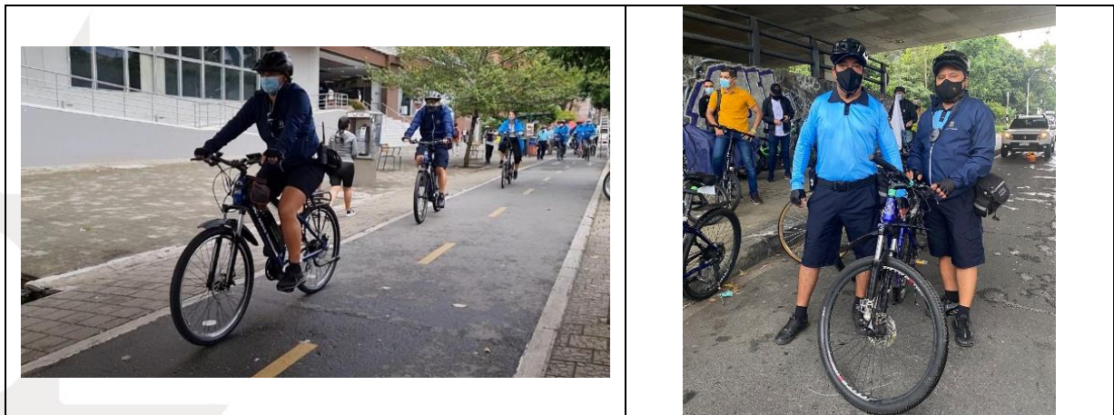
Tabla 10. Registro fotográfico

Por otro lado, se continúan con los controles de emisiones a fuentes móviles desde dentro de la zona ZUAP, realizando 1402 pruebas durante este trimestre tal como se muestra a continuación: