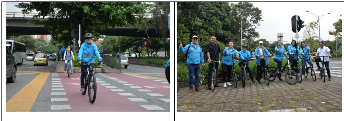
Tabla 7. Registro fotográfico

Así mismo, se muestra a continuación el registro fotográfico de las diferentes actividades realizadas como implementación de la campaña: