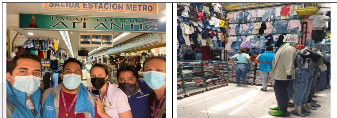
Tabla 6. Registro fotográfico

Abordando el público estratégico de comerciantes realizaron 15 entre reuniones, sensibilizaciones, recorridos y voz a voz: