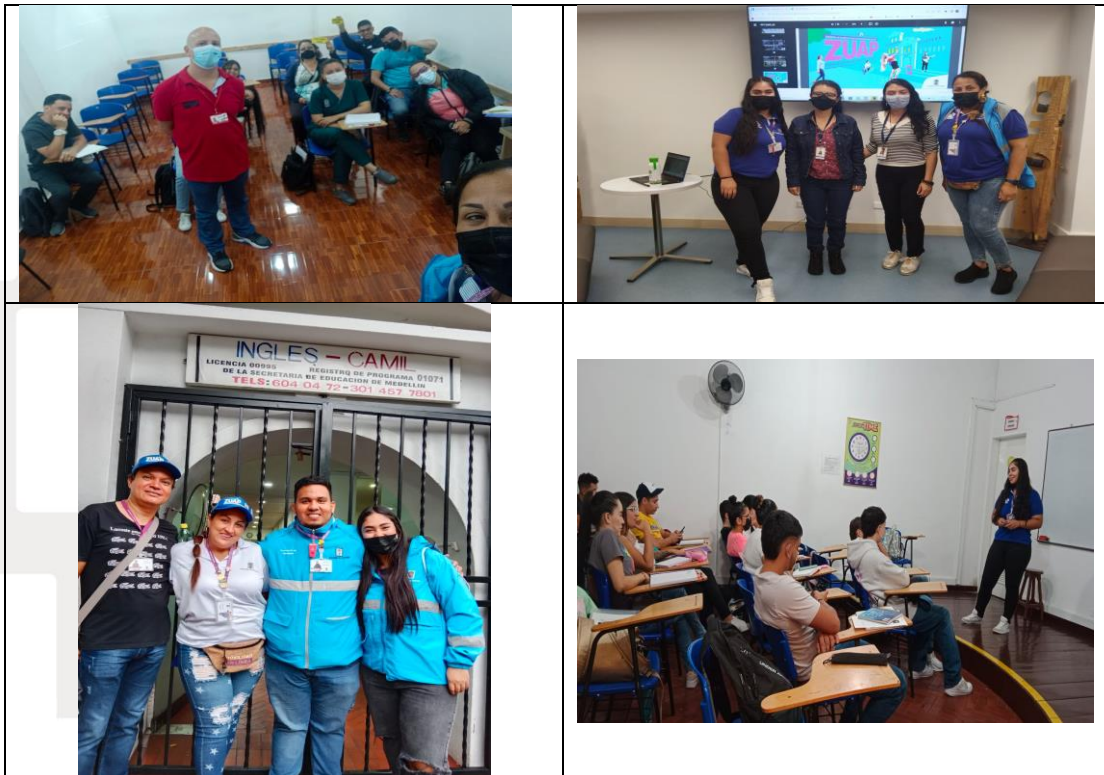
Tabla 4. Registro fotográfico

Centro Administrativo Municipal CAM Calle 44 N° 52-165. Código Postal 50015 Línea de Atención a la Ciudadanía: (57) 44 44 144 Commutador: 385 5555 Medellín - Colombia