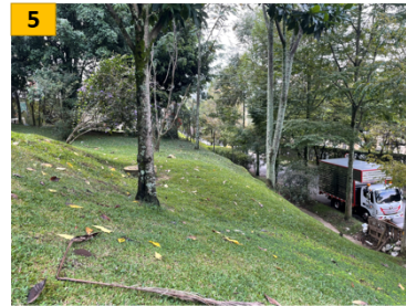
Foto 1 a la 5. Estado y cobertura de la zona verde.

El espacio solicitado para convertir en parque ambiental posee un área verde de aproximadamente 20.666 m 2 y está conformada por seis lotes cuyos CBML son: 15111010058, 15111010017, 15111010087, 15119990099, 15111010073, los cuales corresponden a predio público y el CBML 15111010096 a predio privado. De esta área solo un tramo, con un área 2.324 m 2 , corresponde a suelo de protección, clasificado como área de amenaza alta por movimientos en masa (imagen 2) y que pertenece a los CBML 15111010017, 15111010087, 15111010073.