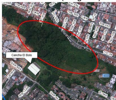
Imagen 1. Ubicación de la zona verde solicitada como parque ambiental ubicado en la carrera 55B No. 12AA Sur-70.

Respuesta: En atención a la solicitud efectuada, le informamos que el 22 de diciembre del presente año, personal de la Secretaría de Medio Ambiente realizó visita a la carrera 55B No. 12AA Sur-70. La zona verde solicitada para convertir en parque ambiental se ubica en la parte trasera de la cancha el Bolo (imagen 1).