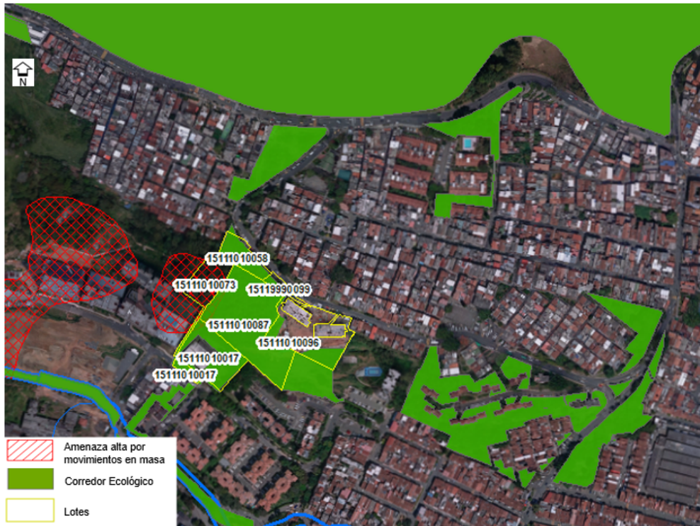
Imagen 3. Zona verde ubicada en la carrera 55B No. 12AA Sur-70 y su articulación dentro de los Corredores ecológicos.

Distrito de Ciencia, Tecnología e Innovación