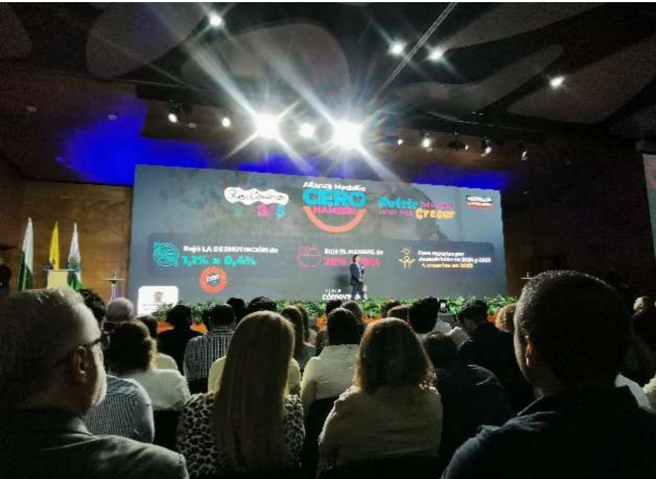
Presentación de avances y resultados de la gestión de gobierno.