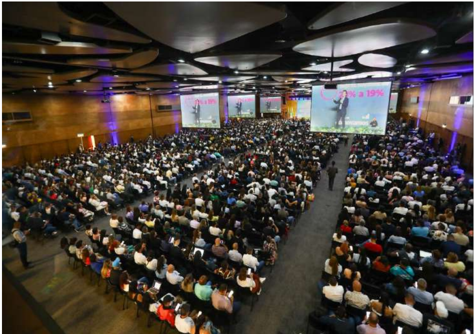
Participantes al evento.