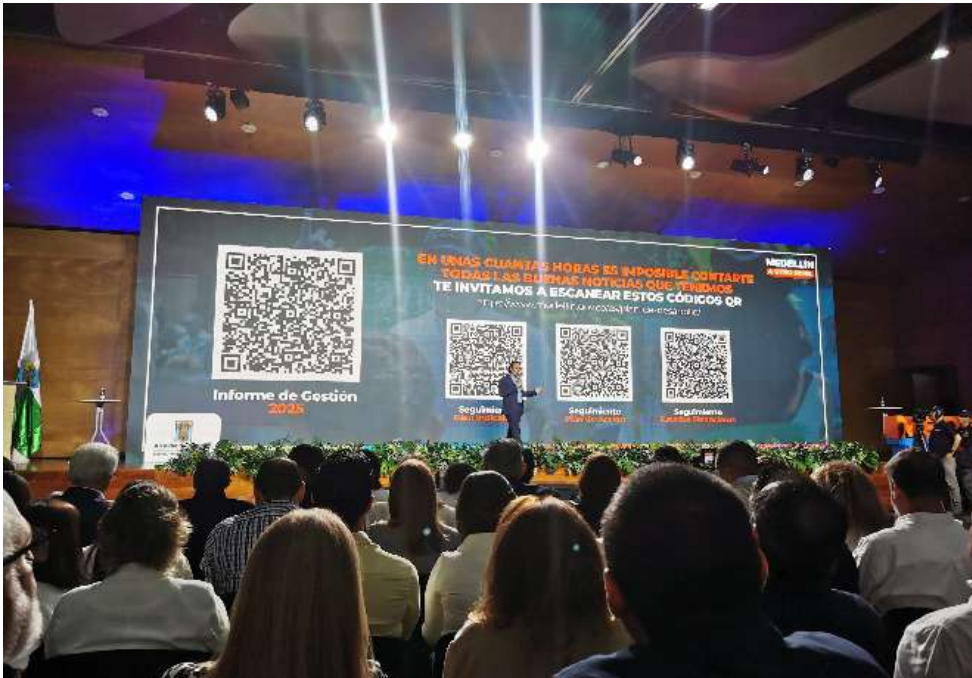
Proyección de instrumentos de seguimiento al Plan de Desarrollo Distrital: Plan Indicativo, Plan de Acción y Estados Financieros de la Entidad.