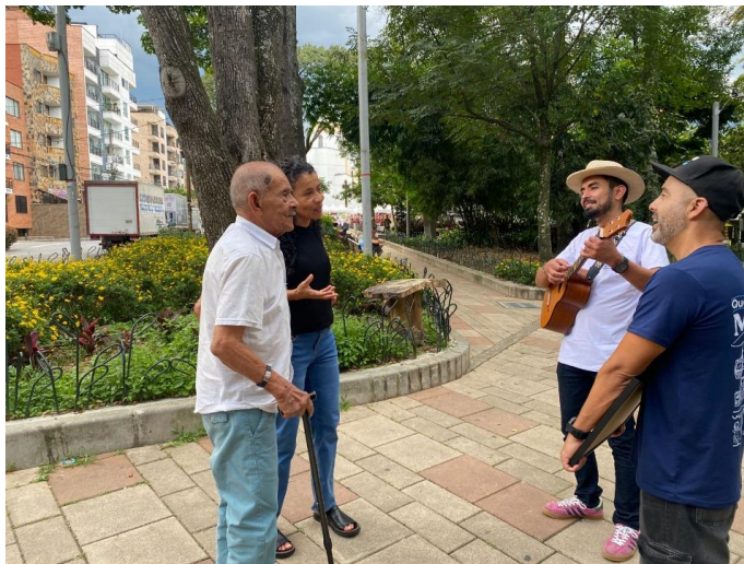
Trova del orgullo en parque de la Floresta. Comuna 12- La América Secretaría de Cultura Ciudadana.