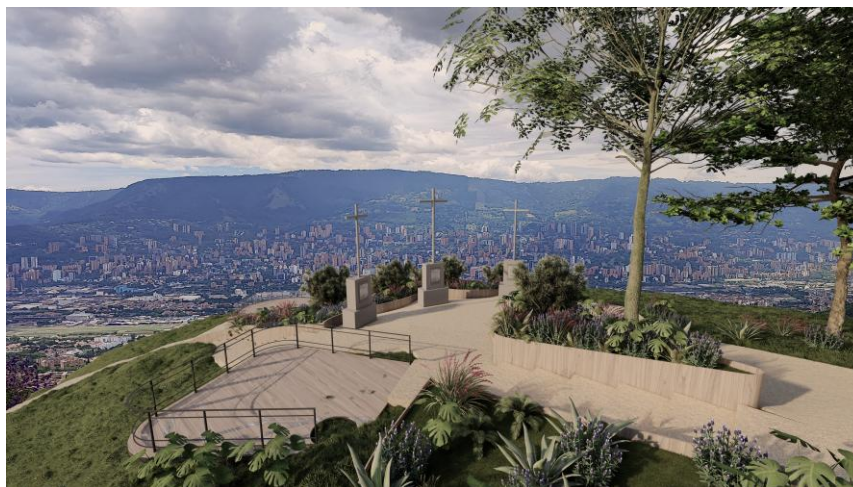
Render cima del cerro Las Tres Cruces. Corregimiento 70- Altavista. Secretaría de Medio Ambiente.