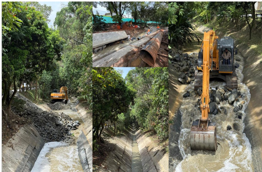
Corredores azules. Comuna 16- Belén (quebrada Altavista). Secretaría del Medio Ambiente.