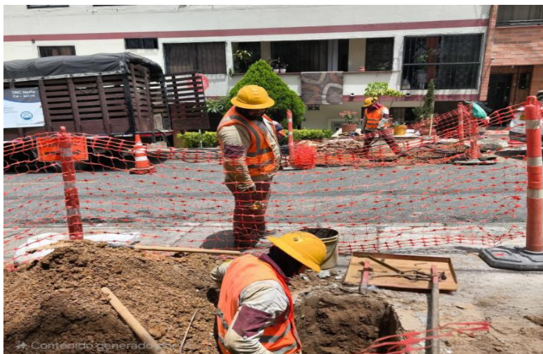
Programas Unidos por el Agua. Comuna 16- Belén. Secretaría de Gestión y Control Territorial.