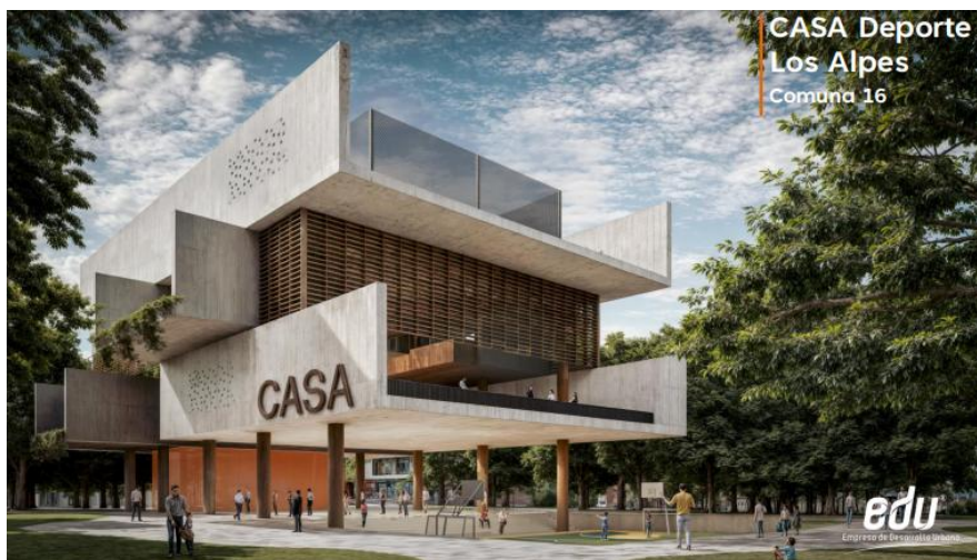
Recreo Belén los Alpes. Comuna 16- Belén. INDER Medellín.