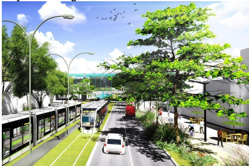
Render Estación Floresta Metro de la 80. Comuna 12- La América. Metro de Medellín.