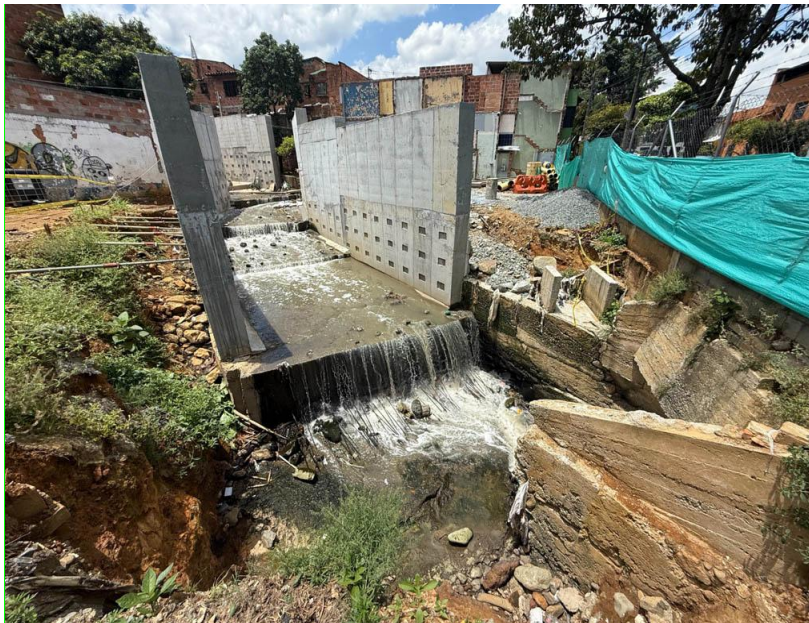
Construcción del canal de la quebrada La Honda. Comuna 4- Aranjuez - Secretaría de Medio Ambiente.