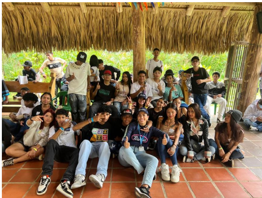
Sesión de formación en Parceros. Finca Presencia Colombo Suiza Alcaldía de Medellín.