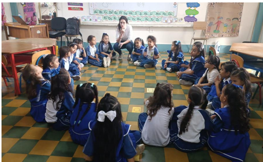
Institución educativa Alvernia - Actividad de formación en preescolar. Comuna 4 - Aranjuez.