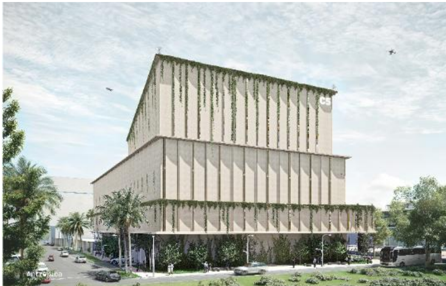
Render fachada occidental y norte Complejo de Seguridad Distrital. Comuna 10- La Candelaria. Secretaría de Seguridad y Convivencia.