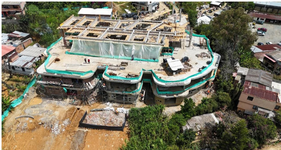
Avance de obra Jardín Infantil Buen Comienzo Chambacú. Corregimiento 60- San Cristóbal.

Secretaría de Educación Distrital - Empresa de Desarrollo Urbano (EDU).