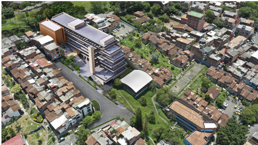
Institución Educativa El Diamante. Comuna 7- Robledo.

Secretaría de Educación Distrital - Empresa de Desarrollo Urbano (EDU).