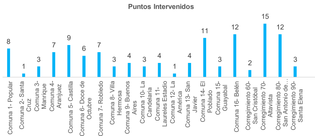
Gráfico 1. Comunas y Corredores Azules, según comunas y corregimientos, Distrito de Medellín, 2025