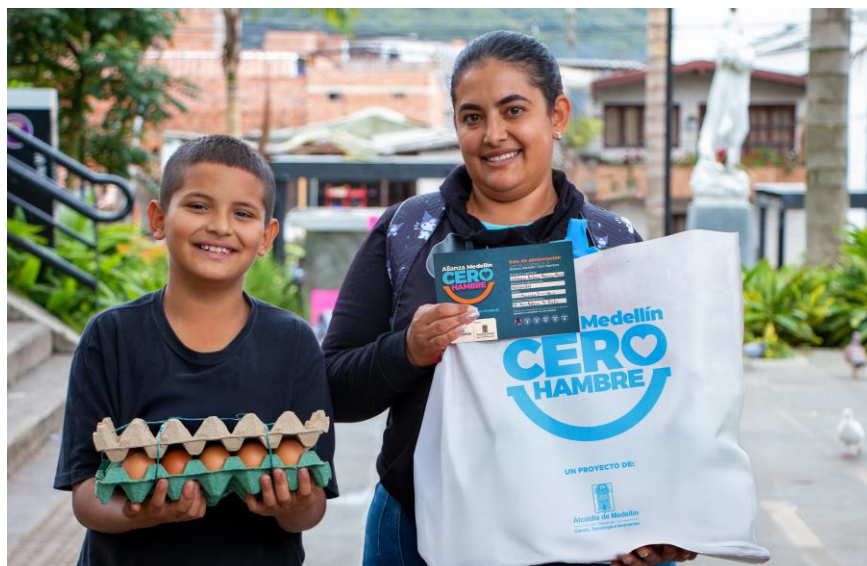
Familia beneficiaria de la Alianza Medellín Cero Hambre – Vale alimentario. Corregimiento 80 - San Antonio de Prado. Secretaría de Inclusión Social y Familia.