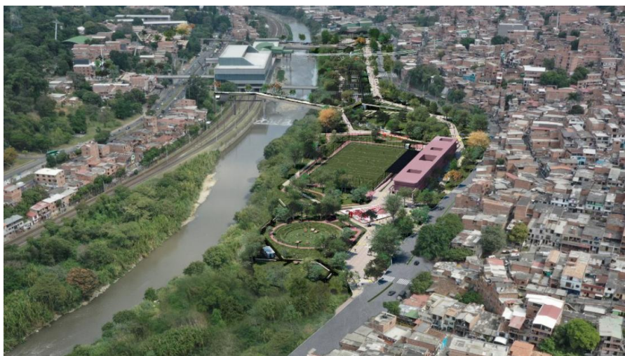
Proyecto Primavera Norte. Comunas 1- Popular y 2- Santa Cruz. Secretaría de Infraestructura Física.