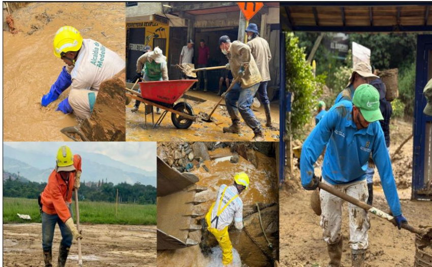
Apoyos técnicos cuadrillas de Secretaría de Medio Ambiente. Quebradas del Distrito de Medellín. Secretaría de Medio Ambiente.