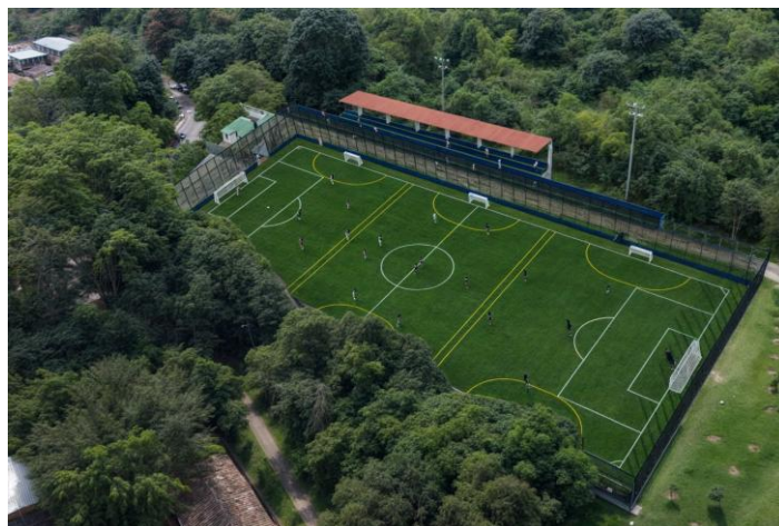
Render - Cancha de fútbol Caunces de Oriente. Comuna 9- Buenos Aires- Inder Medellín.