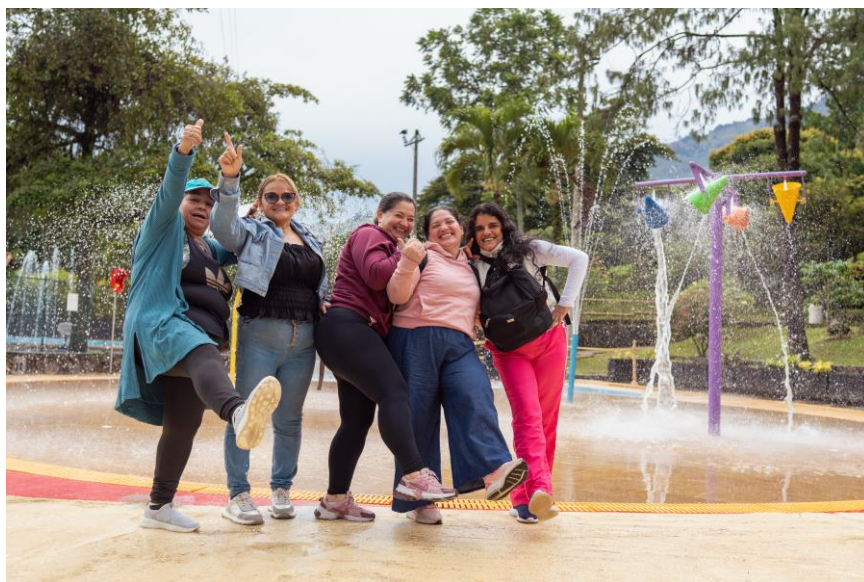
Día de respiro para mujeres cuidadoras. Comfama Las Ballenitas. Municipio de Copacabana. Secretaría de las Mujeres.