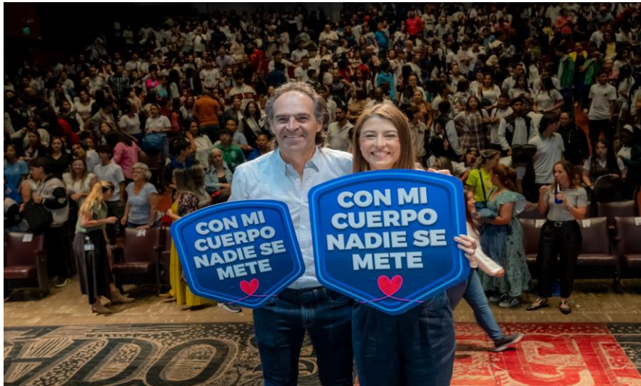
Lanzamiento del concurso digital: Con Mi Cuerpo Nadie Se Mete . Comuna 10- La Candelaria Despacho primera Dama.