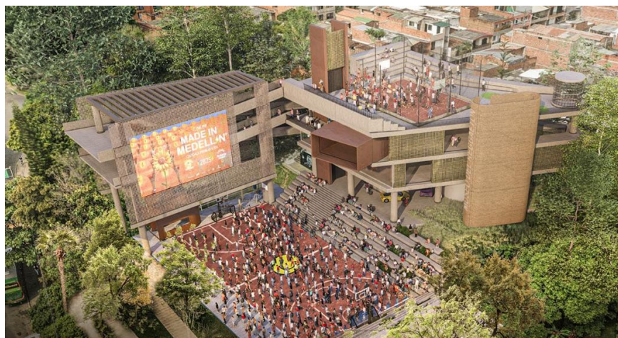
Render - Recreo Cultural Castilla. Comuna 5- Castilla. Secretaría de Cultura Ciudadana.

Alcaldía de Medellín Distrito de Ciencia, Tecnología e Innovación