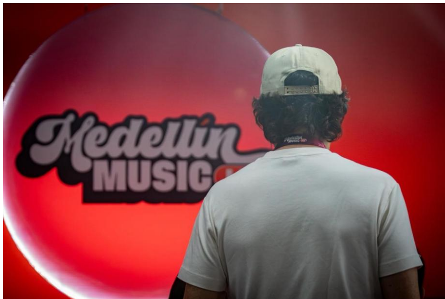
Campamento Medellín Music Lab. Alcaldía de Medellín.