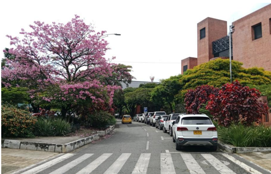
Corredores verdes. Comuna 10- La Candelaria. Secretaría de Infraestructura Física.