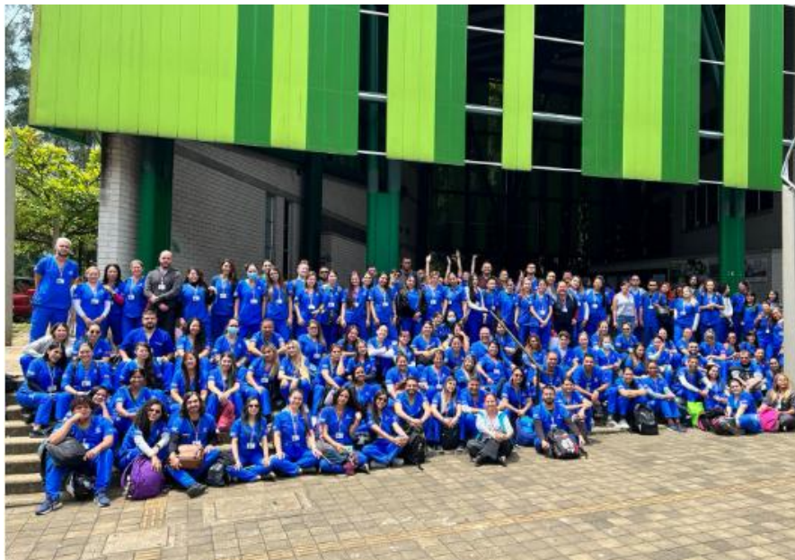
Profesionales de psicología- Entorno educativo. Distrito de Medellín. Secretaría de Salud.