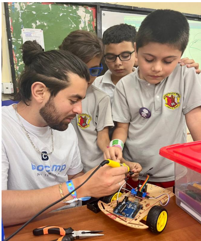
Campamento de habilidades digitales. Institución Educativa Dinamarca. Comuna 5 – Castilla. Secretaría de Educación.

Proyecto estratégico: Formación en habilidades digitales.