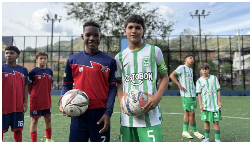
Miniclásico. Comuna 9 - Buenos Aires. Secretaría de Seguridad y Convivencia.