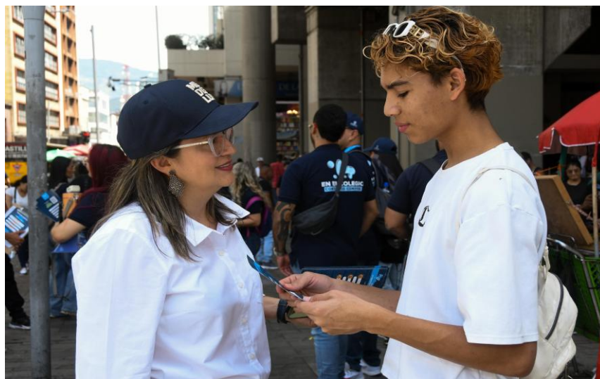
Búsqueda activa en campaña de matrícula – junio de 2025. Comuna 10 - Candelaria. Secretaría de Educación.