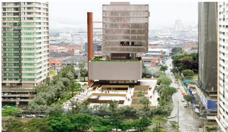
Render - Recreo Cultural Ciudad del Río. Comuna 14- El Poblado Secretaría de Cultura Ciudadana.