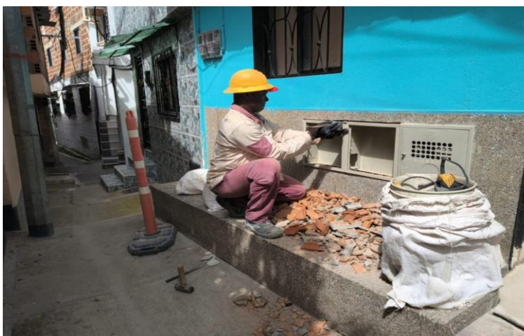
Programa Unidos por el Gas. Comuna 16- Belén. Secretaría de Gestión y Control Territorial.