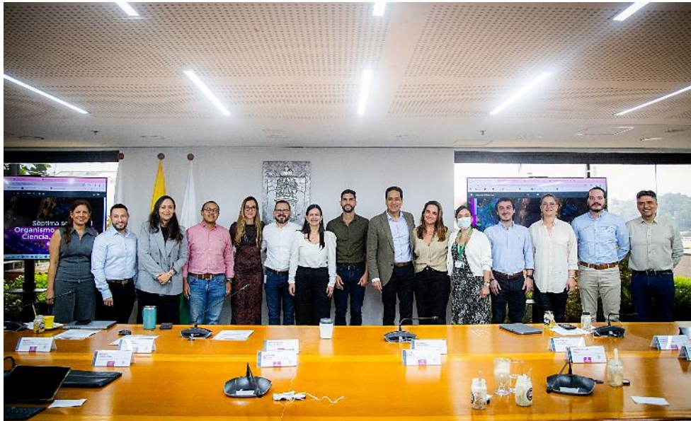
Séptima Sesión Ordinaria – Organismo asesor Comuna 10- La Candelaria. Departamento Administrativo de Planeación.