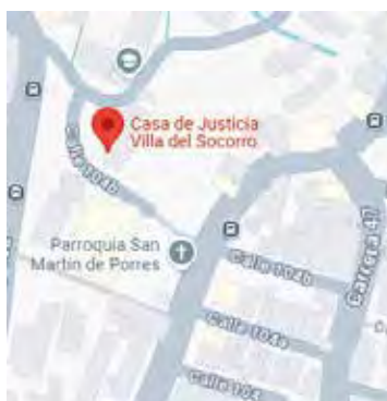
Imagen de Google Maps