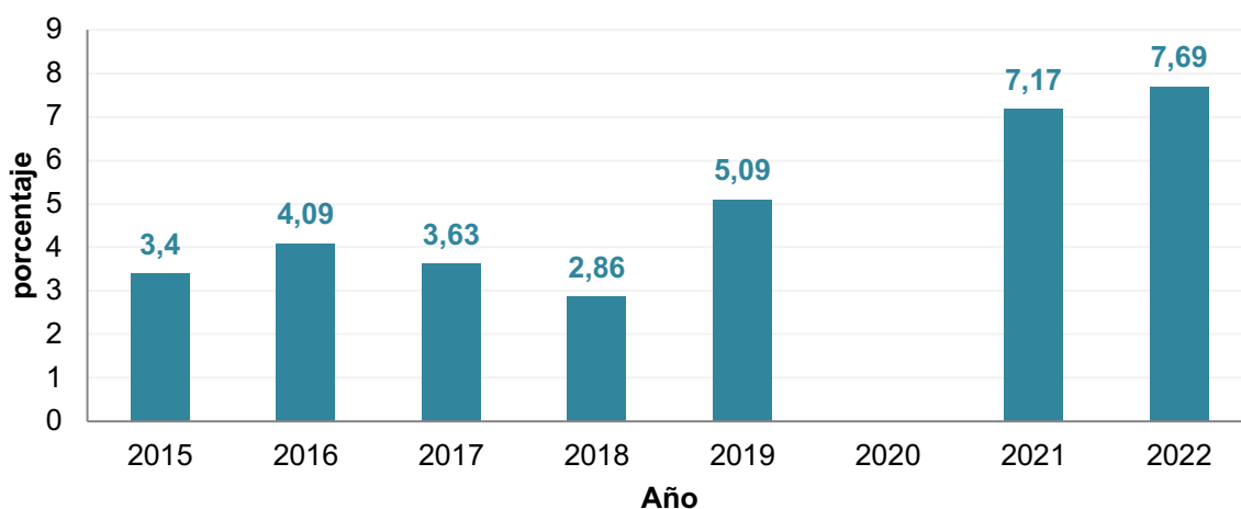
Gráfico 1. Incidencia de pobreza monetaria extrema (Urbano)