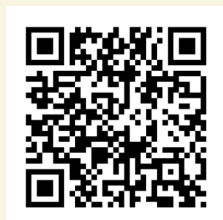
Cámara de Comercio de Medellín para Antioquia.