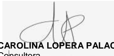
CAROLINA LOPERA PALACIOS Consultora