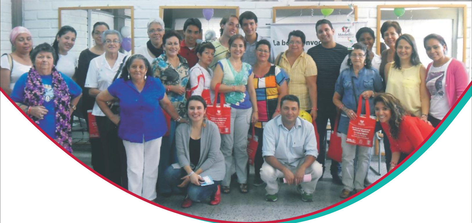
Arriba izquierda: Posicionamiento formulación PPSB para Medellín Jornada saludable "Salud en el Hogar" Metrosalud en el barrio Villa Flores. Arriba Derecha: Reunión Grupo Gestor formulación PPSB para Medellín. Abajo: Taller sonrisoterapia con actores comunitarios