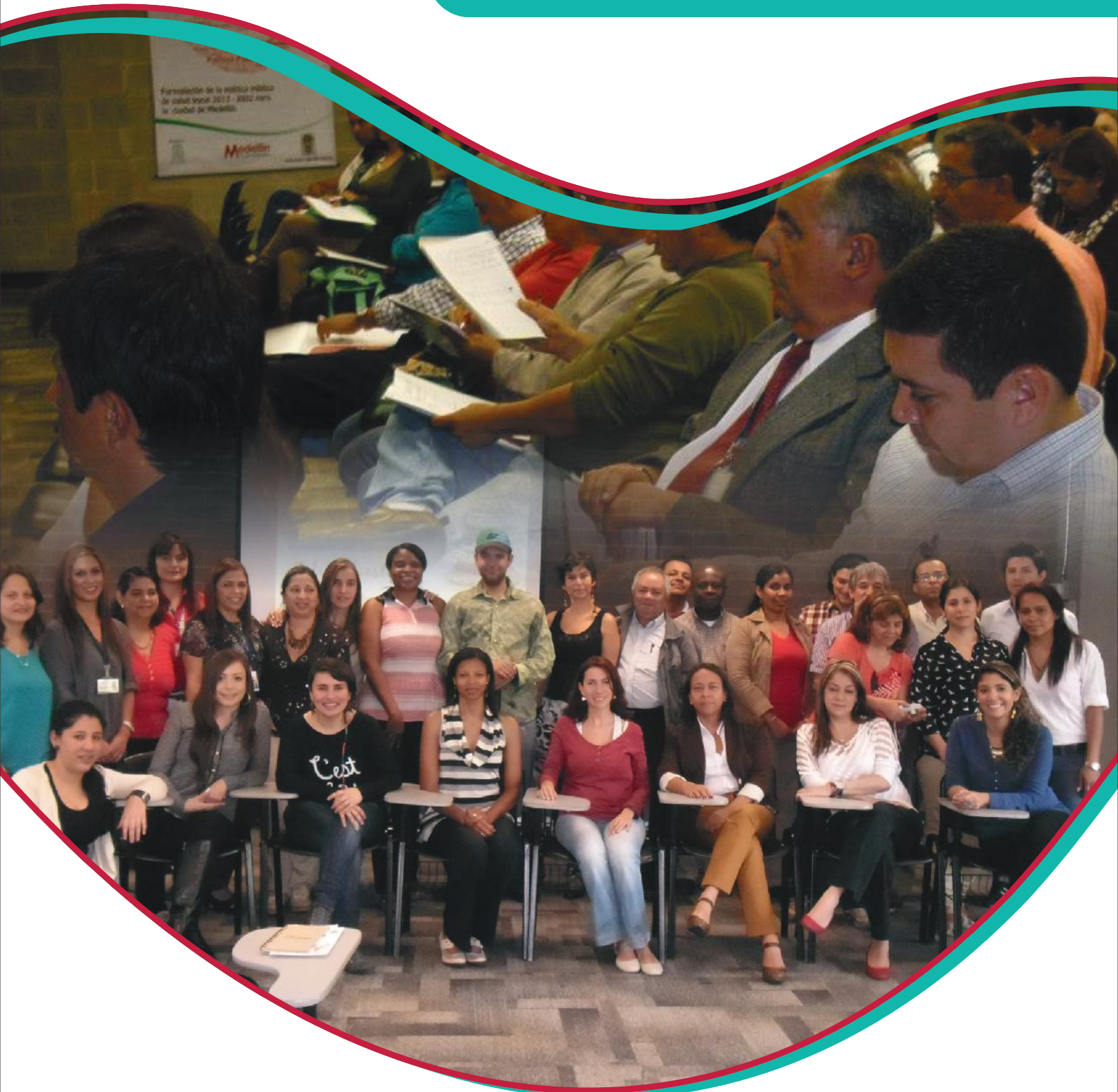
Arriba: Instalación Grupo Gestor formulación PPSB para Medellín. Abajo: Plenaria grupos de trabajo formulación PPSB para Medellín.