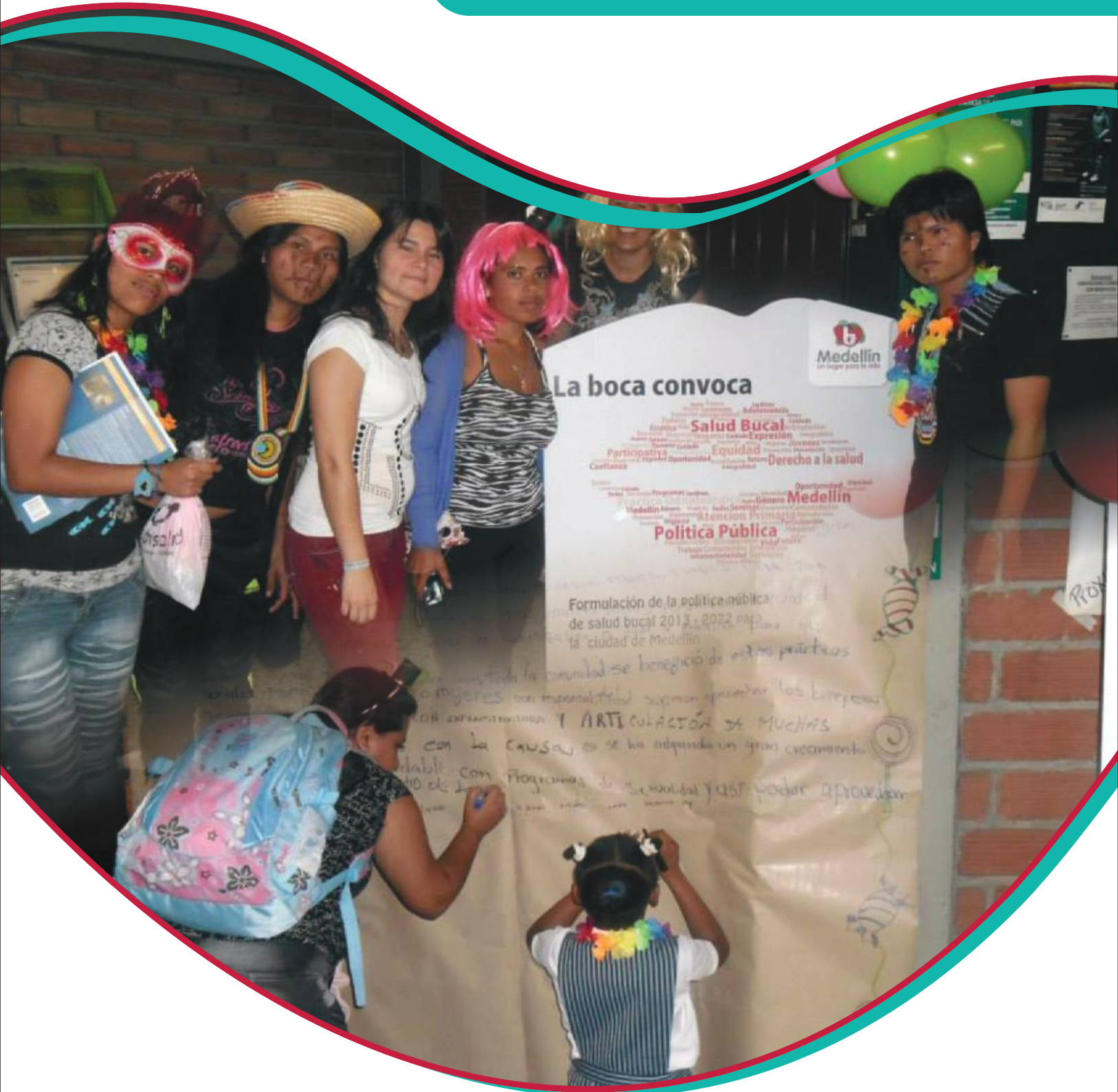
Posicionamiento formulación PPSB en las jornadas de extensión Facultad Nacional de Salud pública, Universidad de Antioquia.