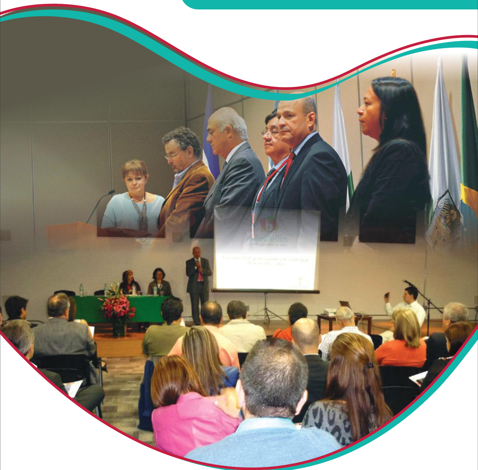
Arriba: Instalación seminario internacional "Políticas públicas en salud bucal, para la garantía del derecho a la salud". Abajo: Conformación Grupo Gestor inicio formulación Política Pública de Salud Bucal para Medellín, presentación Secretario de Salud de Medellín.