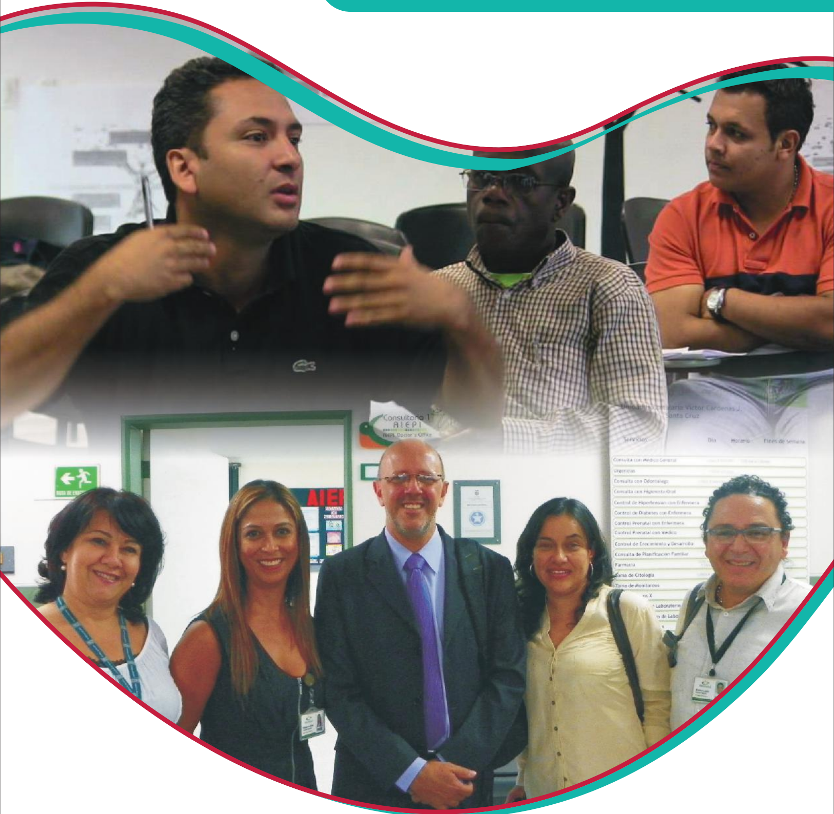
Intercambio internacional con coordinador nacional de la política de salud bucal de Brasil, visita a la ESE Metrosalud.