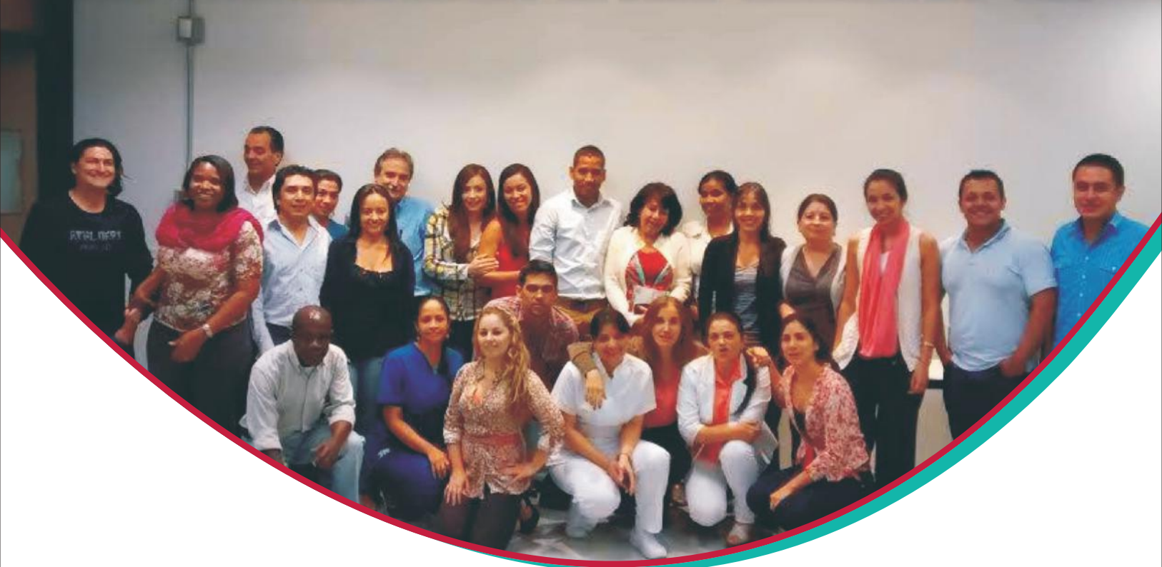
Arriba: Espacios del seminario Internacional "Políticas públicas en salud bucal, para la garantía del derecho a la salud". Abajo: Grupo de estudiantes Diplomado de Políticas Públicas en salud bucal para Medellín.