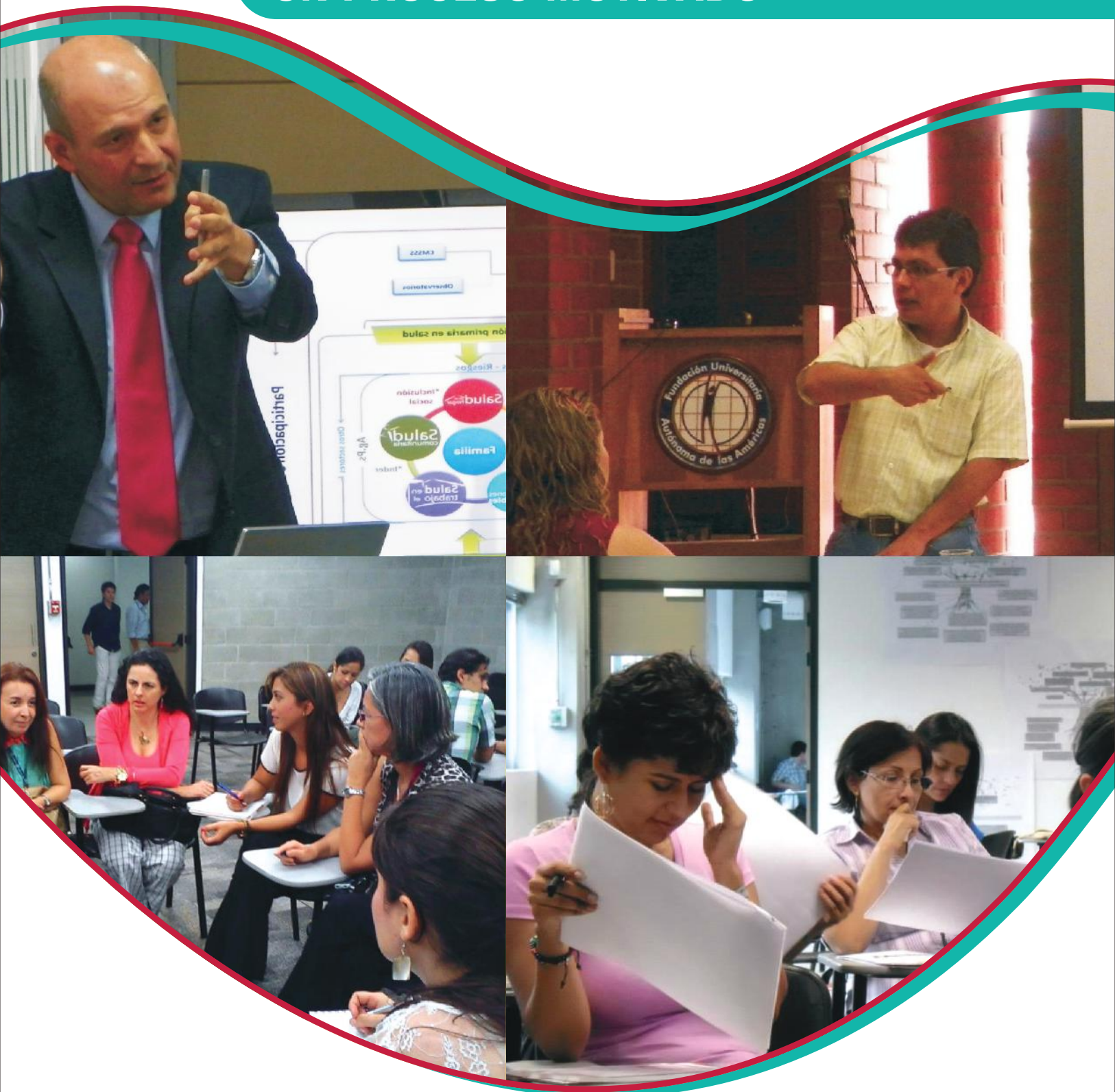
Discusión lineamientos de la política pública de salud bucal con el Secretario de Salud de Medellín.