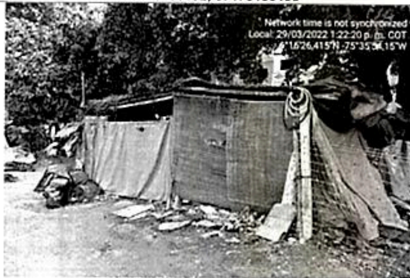
Foto 1, Predios 1-2-3 en materiales reciclados

REGISTRO FOTOGRÁFICO PREDIOS CON CBML: 07170130175, 07170130174, 07170130172, 07170130169, 07170130168, 07170130191, 07170130195, 07170130192, 07170130193