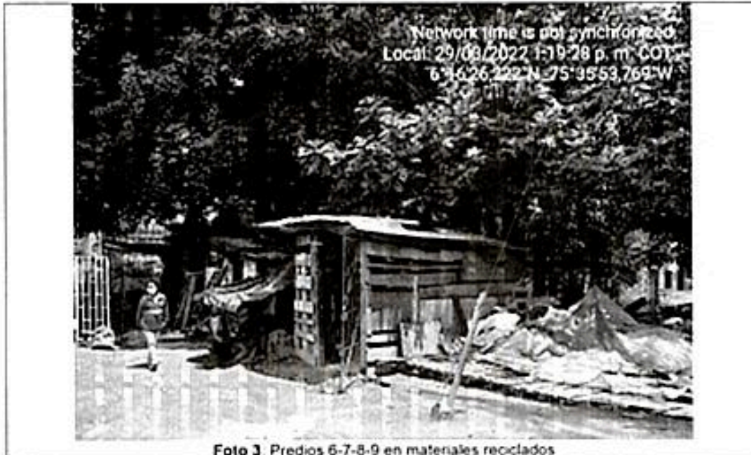
Foto 3. Predios 6-7-8-9 en materiales reciclados

Una vez consultadas las bases de datos del Municipio de Medellín, como son UrbaMed, Visor documental 360 y las bases de datos que proveen de las Curadurías Urbanas de Medellín, no se encontró para los lotes, licencia de construcción otorgada recientemente o procesos radicados en estudio. Por lo tanto, estas viviendas se habrían realizado sin licencia de construcción, en consecuencia, estas actuaciones urbanísticas, desatienden lo dispuesto en el Decreto 1203 de 2017, Artículos 2 y 4.