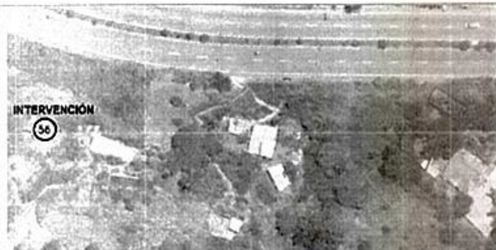
Gráfico 1: Localización de la intervención 56. Coordenadas 6°16'20,269"N-75°37'10,122"W www.medellin.gov.co CBML Mutador: (604) 385 55 55 Medellín - Colombia 07220420001

https://www.medellin.gov.co/MAPGISV5_WEB/mapa.jsp?aplicacion=0