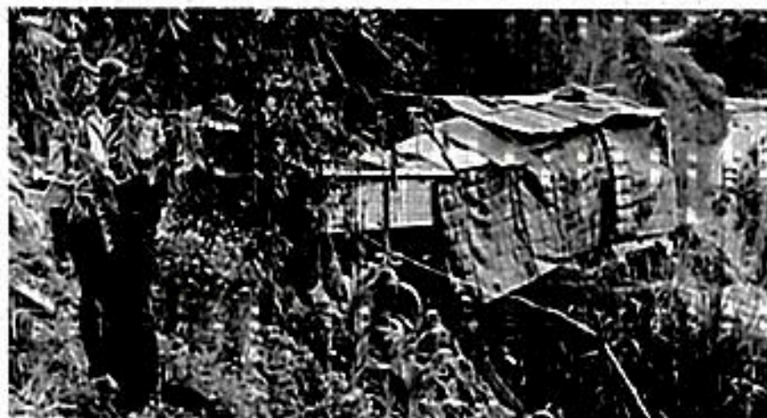
Foto 1: Intervención No.56. Coordenadas 6°16'20,269"N-75°37'10,122"W. Construcción en material no convencional

Una vez consultadas las bases de datos del Municipio de Medellín, como son UrbaMed, Visor documental 360 y las bases de datos que proveen de las Curadurías Urbanas de Medellín, no se encontró para el lote, licencia de construcción otorgada recientemente o procesos radicados en estudio. Por lo tanto, estas viviendas se habrían realizado sin licencia de construcción, en consecuencia, estas actuaciones urbanísticas, desatienden lo dispuesto en el Decreto 1203 de 2017, Artículos 2 y 4.