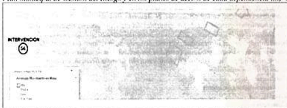
Gráfico 4: Amenaza Baja por movimiento en masa e inundaciones Baja https://www.medellin.gov.co/MAPGISV5_WEB/mapa.jsp?aplicacion=0

Cabe anotar que, según el anterior Acuerdo, en su Artículo 54, "Zonificación de amenaza por movimientos en masa", Numeral 4 "Las áreas urbanizadas, ocupadas o edificadas caracterizadas como de amenaza alta por movimientos en masa, que no poseen estudios de amenaza de detalle, tendrán que someterse a estudios de riesgo de detalle, que permitan definir la categoría del riesgo y si este es mitigable o no mitigable. Las obras de mitigación como resultado de los estudios de amenaza o riesgo de detalle, se deben incorporar en el Plan Municipal de Gestión del Riesgo y en los planes de acción de cada dependencia (...)".